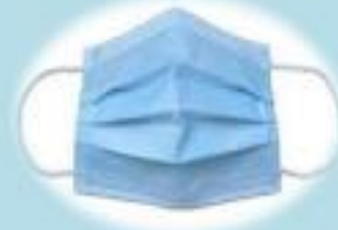
Cerrahi Maske(Tıbbi Maske)

Olası COVID-19 Hastalarına Aerosol(Damlacık) Oluşturan İşlem Yapanlar (Aspirasyon, Bronkoskopi ve Bronkoskopik İşlemler, Entübasyon, Solunum Yolu Numunesi Alınması)