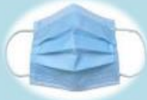
Cerrahi Maske(Tıbbi Maske)

Olası COVID-19 Hastalarına Muayene, Tedavi, Kişisel Bakım Verenler (Doktor, Hemşire Hastabakıcı Vb.)